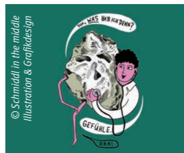
© Schmiedl in the middle Illustration & Grafikdesign

Seelische Leiden sind noch immer ein Tabuthema. Die Fotografin, Malina Bura möchte das gemeinsam mit anderen ändern und darüber sprechen. Ausgestellt werden Portraits von elf Betroffenen, einschließlich der Künstlerin selbst, sowie Texte der jeweiligen Person, die das unterschiedliche Erleben des Themas widerspiegeln.